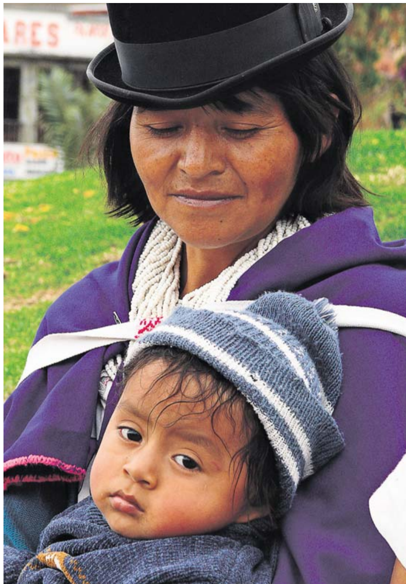
Byen Silvia ligger kun tre kvarter fra Popayan, hvor de lokale som på billedet hver tirsdag har landets måske mest autentiske marked.